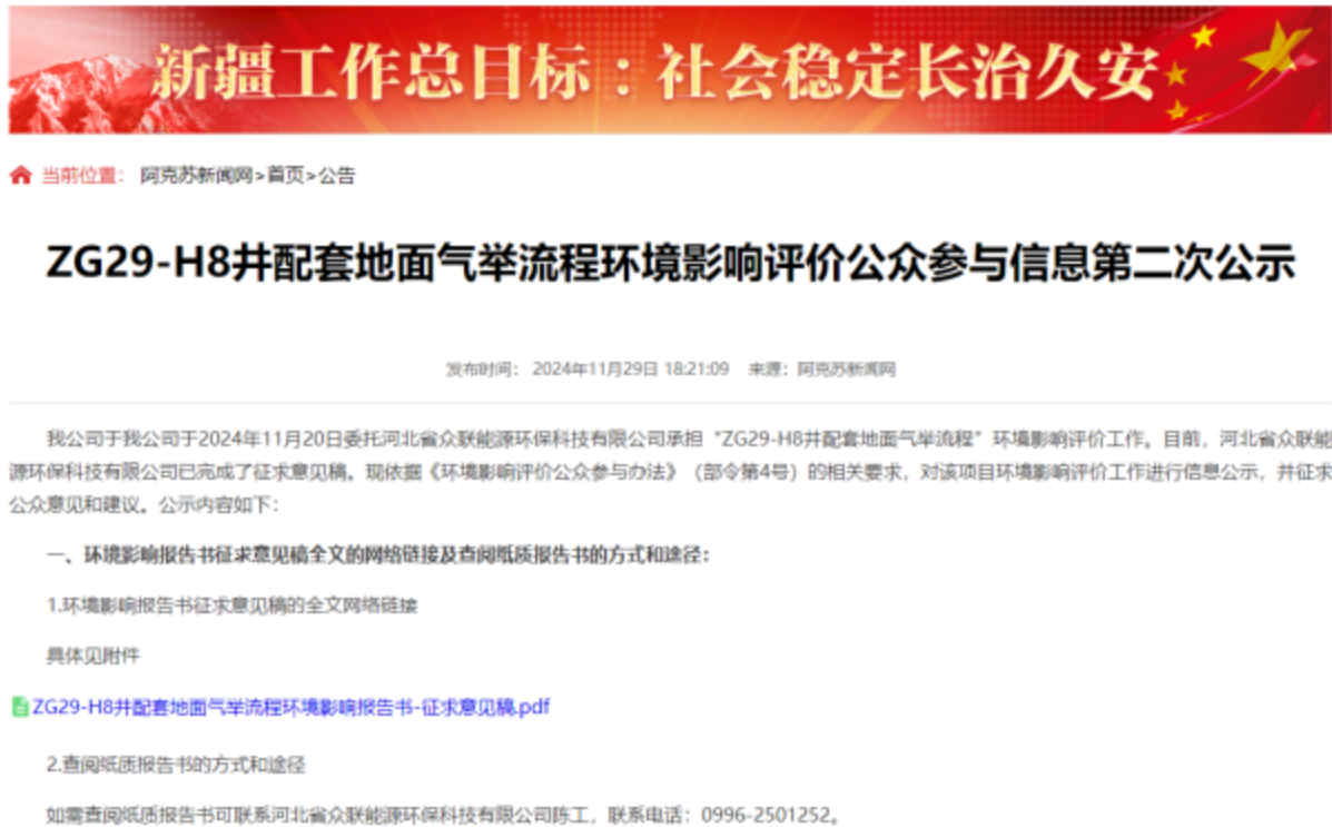
图 3-1 第二次信息公示情况

我公司在《阿克苏新闻网》( https://www.aksxw.com/sy/gg/202411/t20241129_25283497.html )上发布了征求意见稿公示信息,对环境影响报告书征求意见稿全文进行公开,公示时限为10个工作日,网站第二次公示网络截图见图3-1。