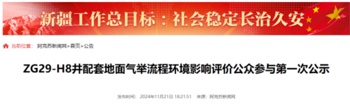
图 2-1 第一次信息公示情况